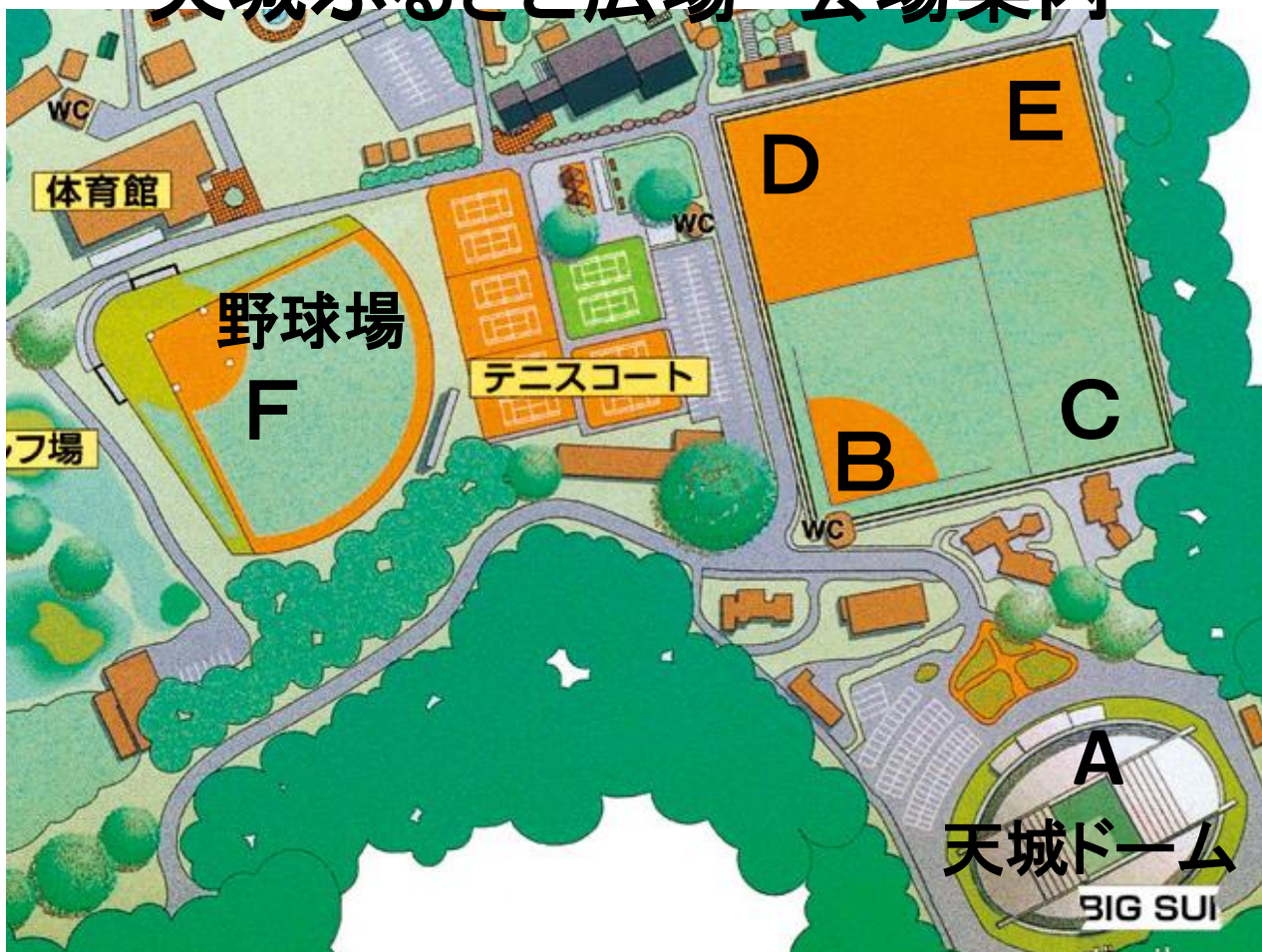
天城ドーム杯 高校女子ソフトボール大会 会場図